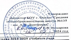
График проведения оценочных процедур в БОУ г. Омска "Средняя общеобразовательная школа №135 им. А.П. Дзюбана" на 1 полугодие 2024-2025 учебного года